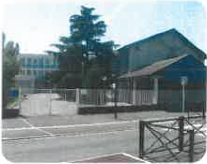
Un peu d'histoire ...